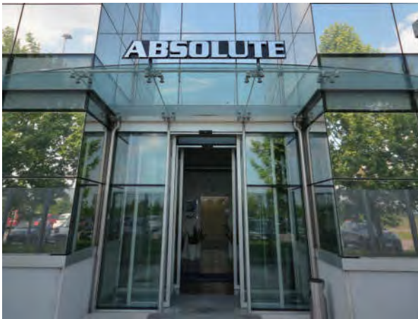
行程第一站Absolute办公区域