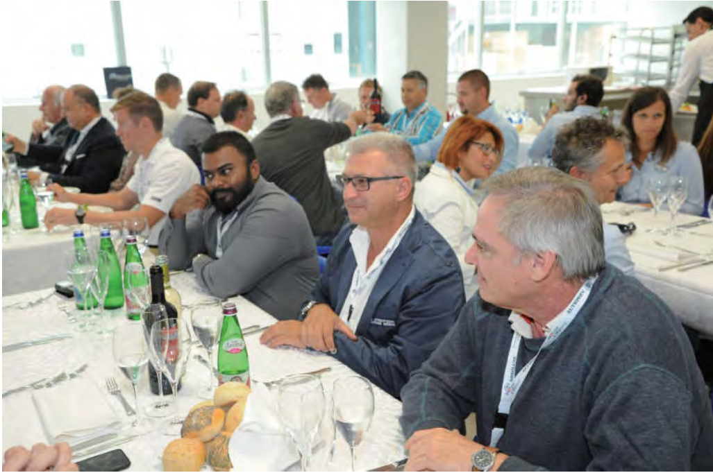
中午在后工业风格的餐厅就餐