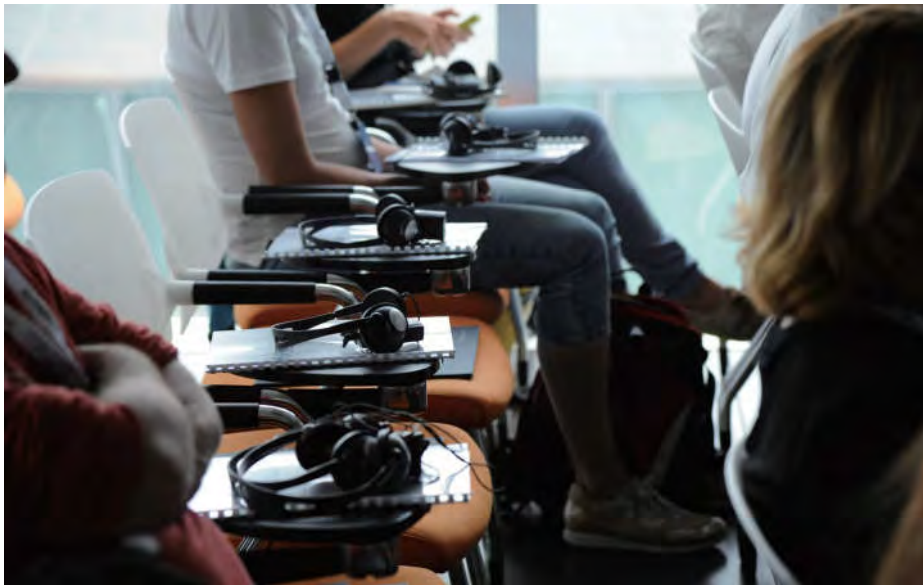
参观船厂车间佩戴的对讲耳机