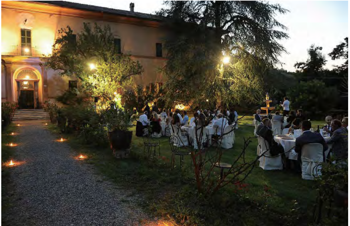
Villa Peyrano 晚餐