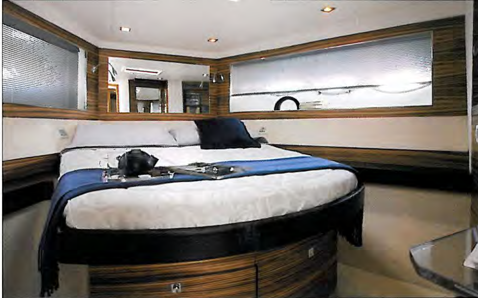
La cabine avant adopte une disposition classique avec le lit double en île adossé à la cloison avant. La décoration est axée autour du Zebra qui habille l'ensemble des emménagements.