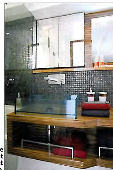
La salle de bains design comporte une douche indépendante. On peut noter le lavabo en verre et la robinetterie contemporaine.