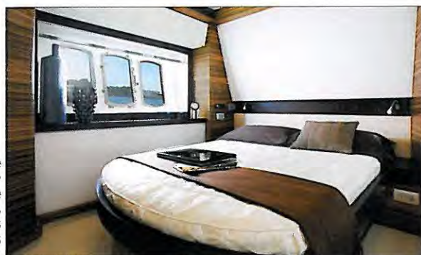
La cabine latérale tribord, considérée comme celle du propriétaire, bénéficie des larges hublots de coque.