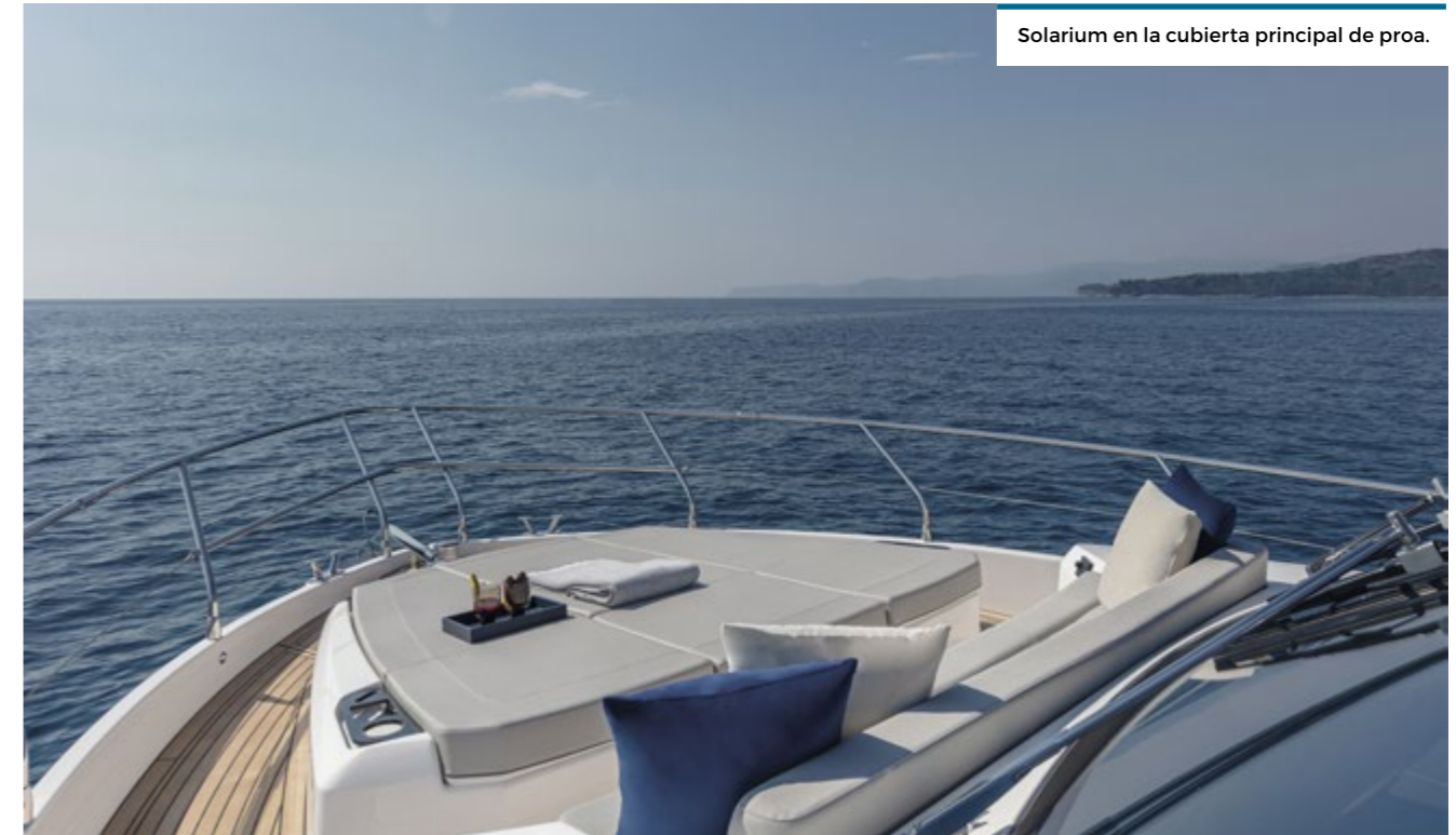
Solarium en la cubierta principal de proa.