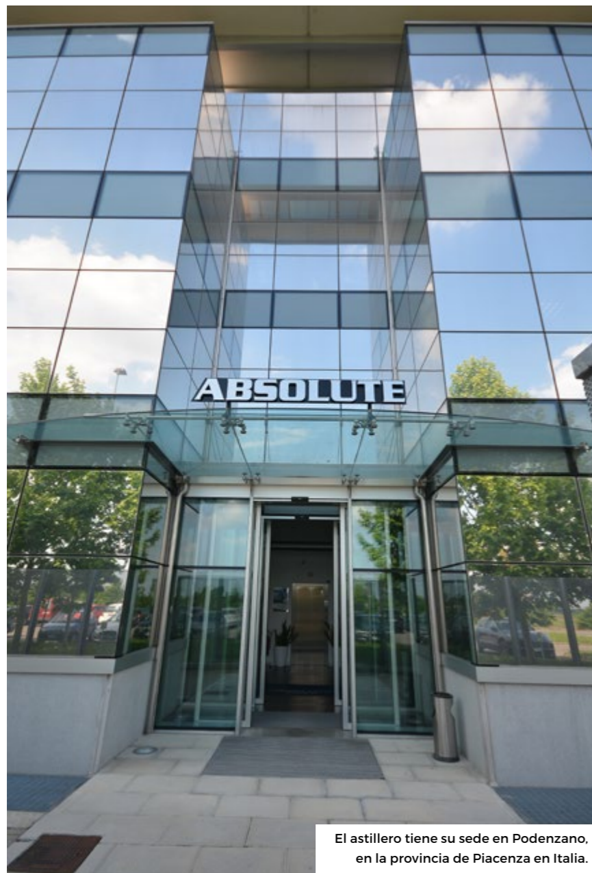
El astillero tiene su sede en Podenzano, en la provincia de Piacenza en Italia.