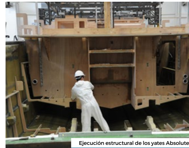
Ejecución estructural de los yates Absolute.

Sus interiores se distribuyen para conseguir una atmósfera cómoda y tranquila a bordo. Su acceso es a través de su popa con un área funcional de bienvenida con vista al mar, permite el fácil acceso, y la libertad de acción sin perder la privacidad.