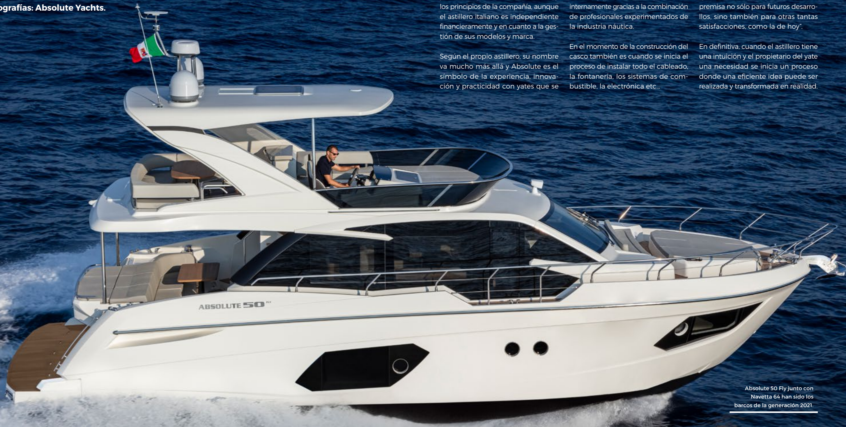
Absolute 50 Fly junto con Navetta 64 han sido los barcos de la generación 2021.

Absolute SpA diseña y construye yates de lujo de 47 a 73 pies en las gamas Navetta, Flybridge y Coupé. El astillero se fundó en 2002 y tiene su sede en Podenzano, Piacenza (Italia).