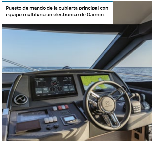
Puesto de mando de la cubierta principal con equipo multifunción electrónico de Garmin.