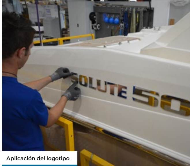
Aplicación del logotipo.