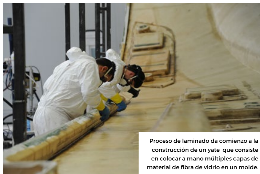
Proceso de laminado da comienzo a la construcción de un yate que consiste en colocar a mano múltiples capas de material de fibra de vidrio en un molde.

Con la idea de mejorar continuamente sus modelos de yates, Absolute se reserva la discreción de producir en sus embarcaciones todas las variaciones posibles puesto que los yates Absolute se ofrecen en el mercado mundial con equipamiento estándar u opcional y puede ser diferente según el país.