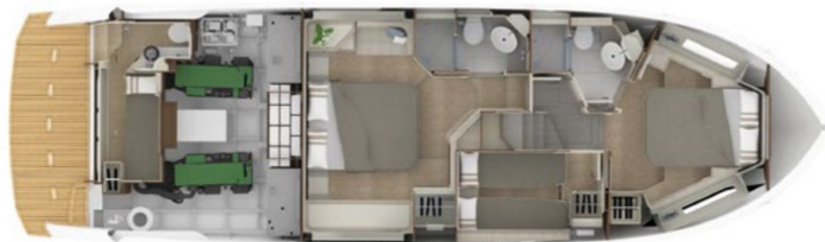
Planos de la cubierta superior, principal e inferior