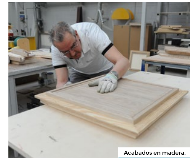
Acabados en madera.

El acceso a la cubierta principal desde popa conecta directamente con la cocina totalmente equipada en el lado de babor de la entrada. La cocina está organizada con un práctico espacio en la encimera para la preparación de alimentos, así como mucho espacio de almacenamiento para cruceros más largos. Un cristal deslizante eléctrico puede abrir la