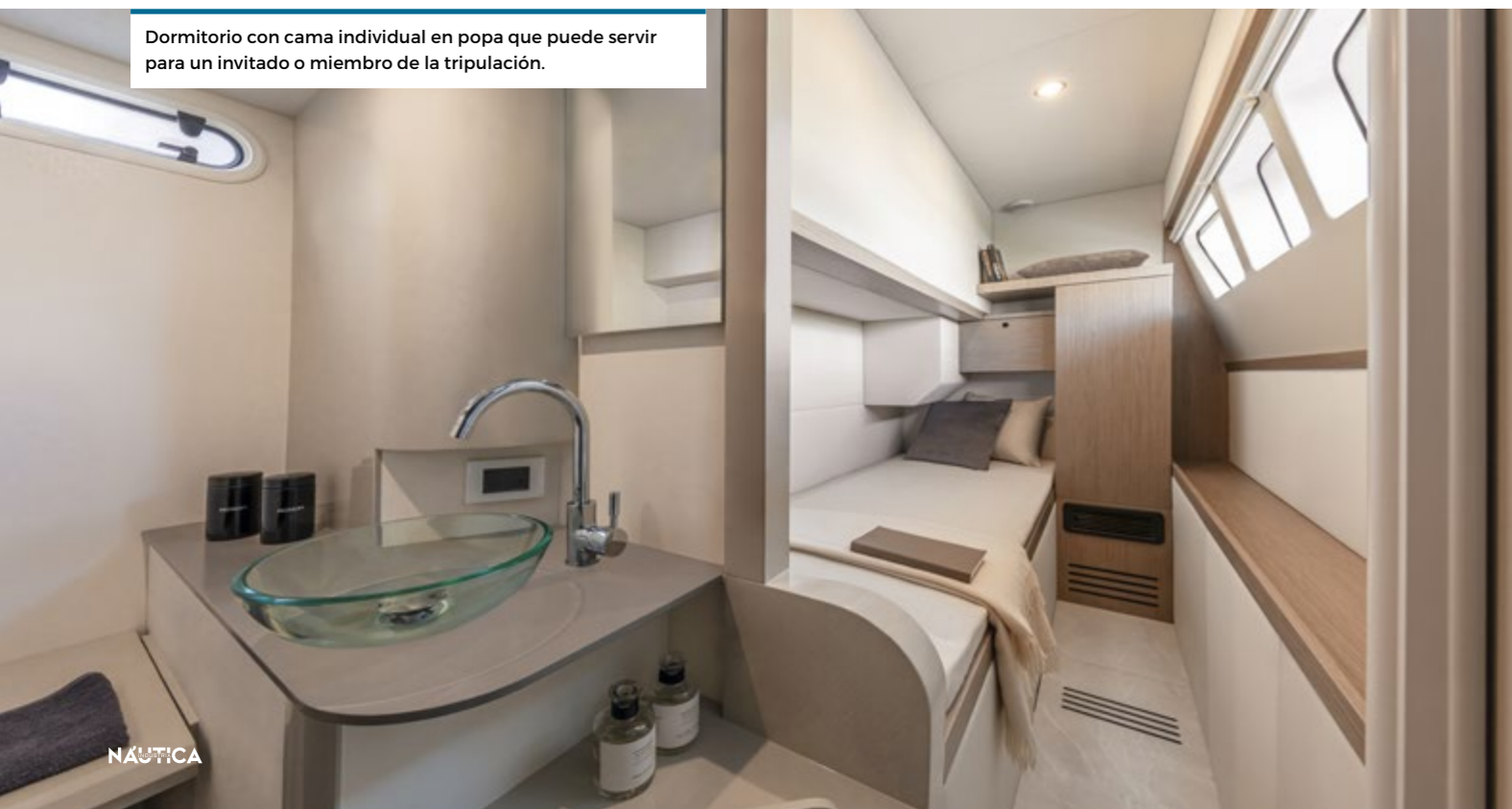
Dormitorio con cama individual en popa que puede servir para un invitado o miembro de la tripulación.

Absolute es el símbolo de la experiencia, la innovación y la practicidad con yates que se valoran en todo el mundo.