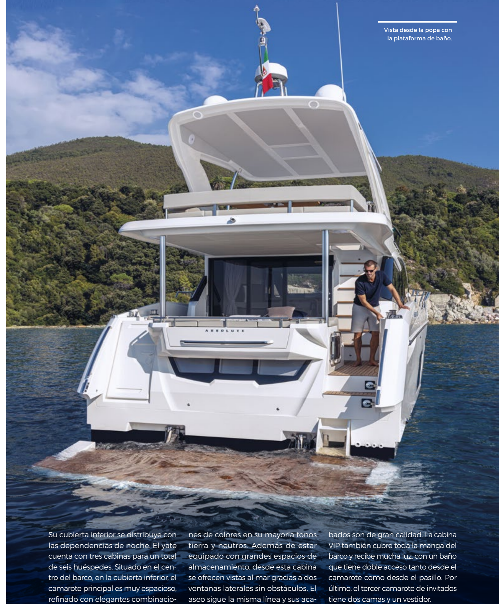
Vista desde la popa con la plataforma de baño.

Los equipos multifunción electrónica del barco son de Garmin y tienen la particularidad de ofrecer la posibilidad de interconectarse entre ellos, lo que favorece la toma de decisiones al tener toda la información concentrada en el puesto de gobierno además de permitir libertad de movimientos gracias a su conexión wifi y toda una serie de prestaciones incluidas en estos equipos.