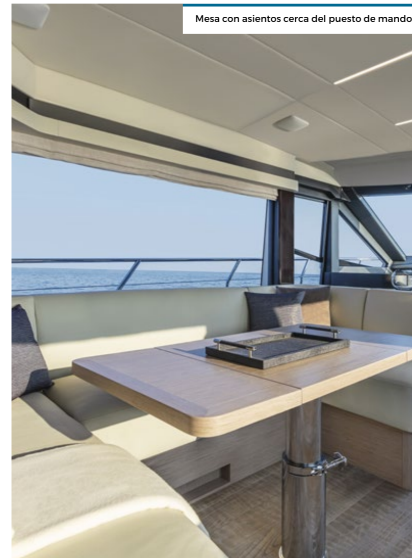
Mesa con asientos cerca del puesto de mando.