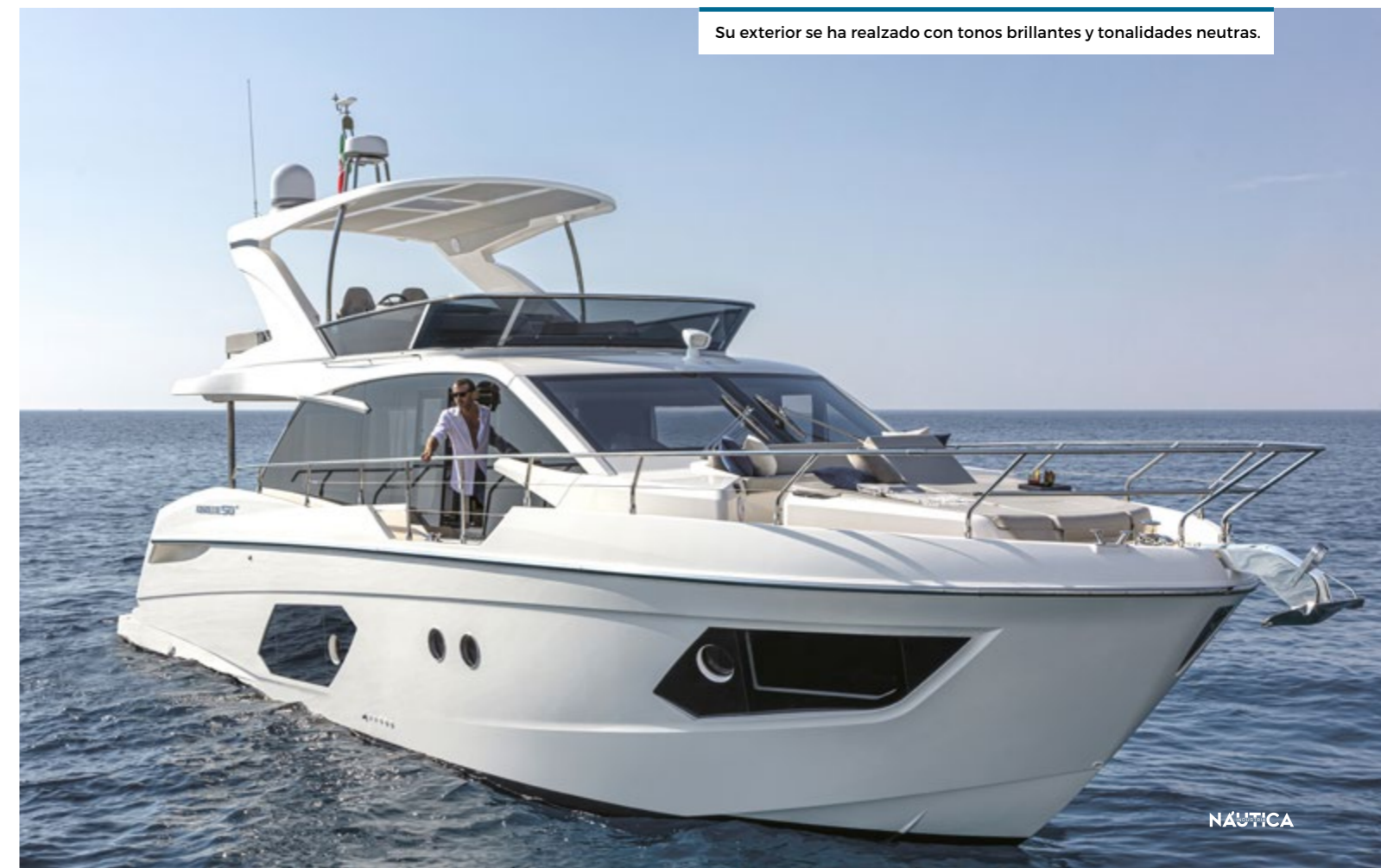
Su exterior se ha realizado con tonos brillantes y tonalidades neutras.

mobiliario, los nuevos sistemas de aire acondicionado y el área de entretenimiento contribuyen a mejorar la experiencia de vida a bordo. El puesto de mando de la cubierta principal es ergonómico, está bien equipado y dispone de una puerta lateral que se abre y que es particularmente útil para maniobrar, y permitir un control completo del yate.