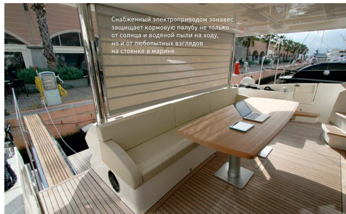
Снабженный электроприводом занавес защищает кормовую палубу не только от солнца и водяной пыли на ходу, но и от любопытных взглядов на стоянке в марине

Все хорошее, увы, быстро заканчивается. По курсу вновь замаячила башня портнядзора со строгими инспекторами. Скорость ровно 5 узлов, кнопка Low Speed светится зеленым огоньком. Особой нужды не было, но >>>