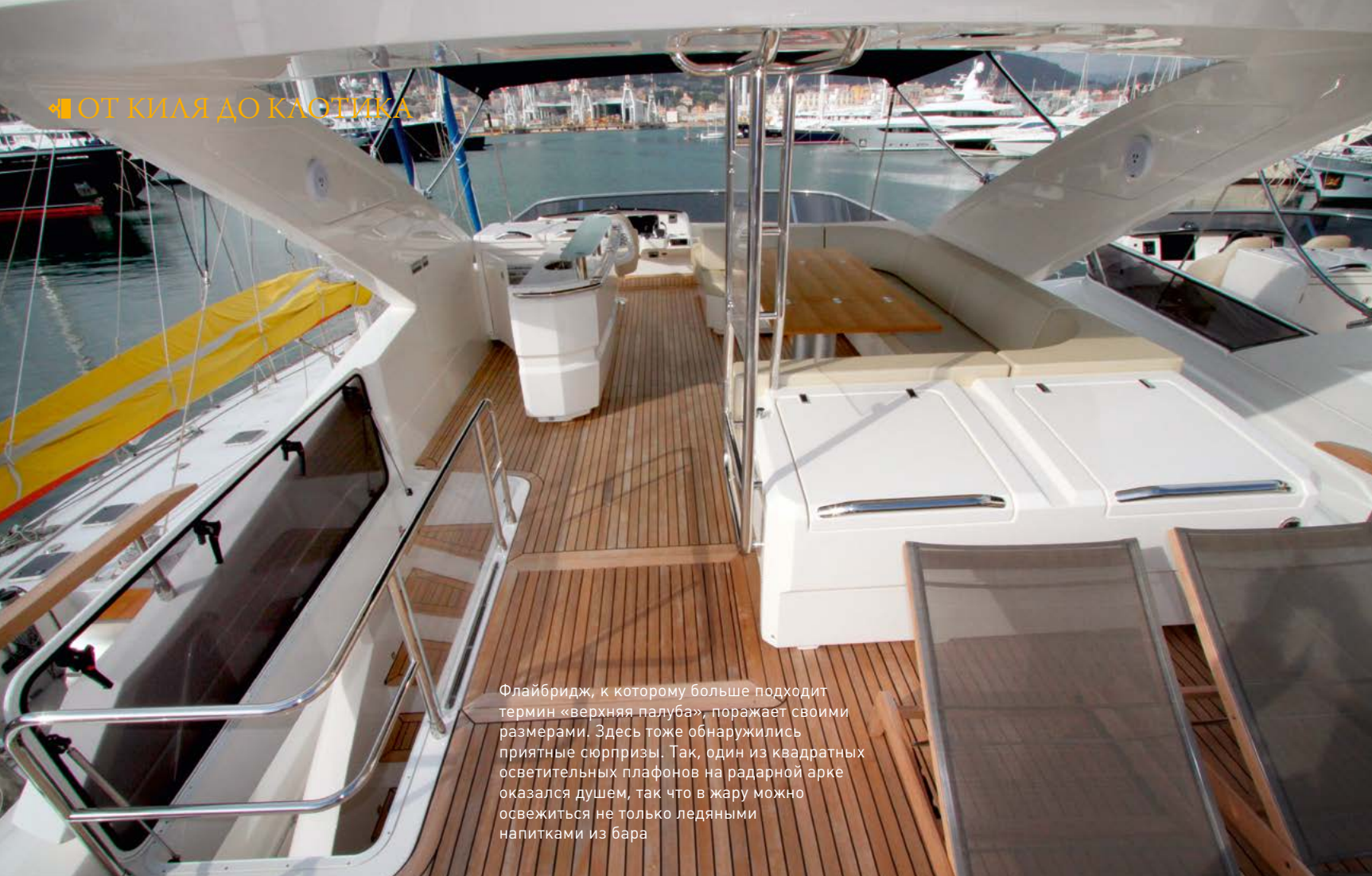
Флайбридж, к которому больше подходит термин «верхняя палуба», поражает своими размерами. Здесь тоже обнаружилось приятные сюрпризы. Так, один из квадратных осветительных плафонов на радарной арке оказался душем, так что в жару можно освежиться не только ледяными напитками из бара