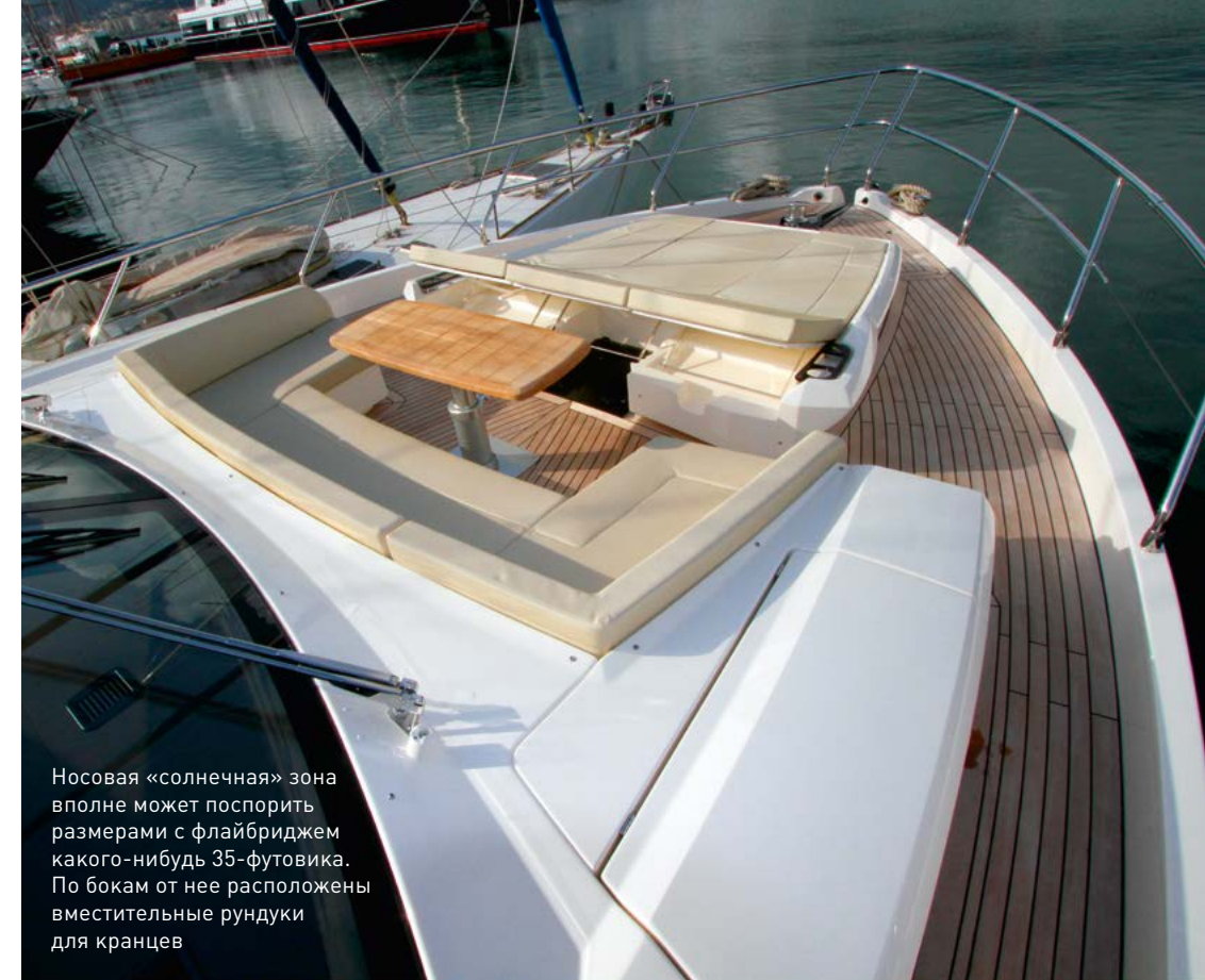
Носовая «солнечная» зона вполне может поспорить размерами с флайбриджем какого-нибудь 35-футовика. По бокам от нее расположены вместительные рундуки для кранцев

Удивительная послушность, отзывчивость и предсказуемость этой быстрой машины так и подстегивали покрутить штурвал (тем более что этого требовали и раскорячившиеся в немислимых позах фотографы на ныряющем в волнах 37-м). Так что я от души повыписывал змейки по его кильватерному следу, совершенно теряющемуся на фоне естественной волны, и выполнил несколько подходов-отходов на параллельных курсах на полном ходу, причем совершенно не обращая внимания, под каким углом к курсу катит волна: 50-тонная лодка плавно, быстро и с агтекарской точностью следовала заданному штурвалом курсу. От пассажиров никаких жалоб не поступало, тем более что крен при таких маневрах не вынуждает хвататься за поручни — это был как раз тот случай «корректированного разворота», при котором в накренившемся на 45° самолете стакан с минералкой продолжает спокойно стоять на столике, а содержимое его не выплескивается наружу. Только в самолете для этого нужно грамотно работать штурвалом и педалями, а Absolute 72 Fly проделывает подобный фокус автоматически. Кое-кто из знакомых с моим обычным стилем езды даже потребовал более острых ощущений, но дудки — умная электроника, управляющая IPS, исправно «ду-