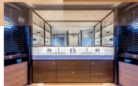
La suite dell'armatore nella zona poppiera è a tutto baglio con il letto in posizione centrale e il bagno esteso su tutto il lato di sinistra. All'estrema poppa c'è l'alloggio per l'equipaggio con due cabine, di cui una con accesso diretto alla sala macchine.