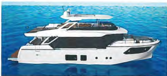
Navetta 73: Kompakt-Explorer von Absolute Yachts.