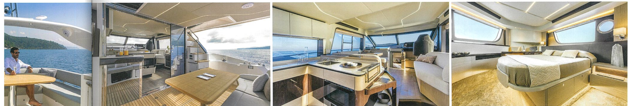
左:この位置にギャレーを配置することで、ハウス後部のスライドドアと窓を開ければ、船内外が一体化した開放的な空間が生まれる。まさに水に浮かぶコテージ 中:大型のウィンドーを採用することで、船内においてもご覧の通りの景観が広がる。センスよくまとめられた木工に、イタリアンボートの粋を感じる 右:ロワーデッキ、船首部分に配されるマスターステートルーム。パウにボリュームを持たせた船型のおかげもあって、ゆとりあふれる空間に仕上がっている