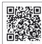
Vídeo Absolute 50 Fly (Absolute Yachts)

El más reciente de los modelos presentado por el astillero italiano Absolute Yachts inicia un nuevo estilo en esta marca y lo hace de forma sobresaliente, lo que le ha valido ser merecedor del trofeo European Power Boat of the Year 2017 en la categoría de esloras superiores a los 45 pies. Un barco puntero en su segmento.