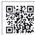
Vídeo Absolute 45 FLY & STY (N&Y Magazine)

A bsolute es una marca de renombre internacional, de gama alta, con un catálogo que presenta una gama muy completa con diseños open, cupé y con fly, todos repartidos en cuatro series, Sport Line, Sport Yachts, Flybridge y Navetta.