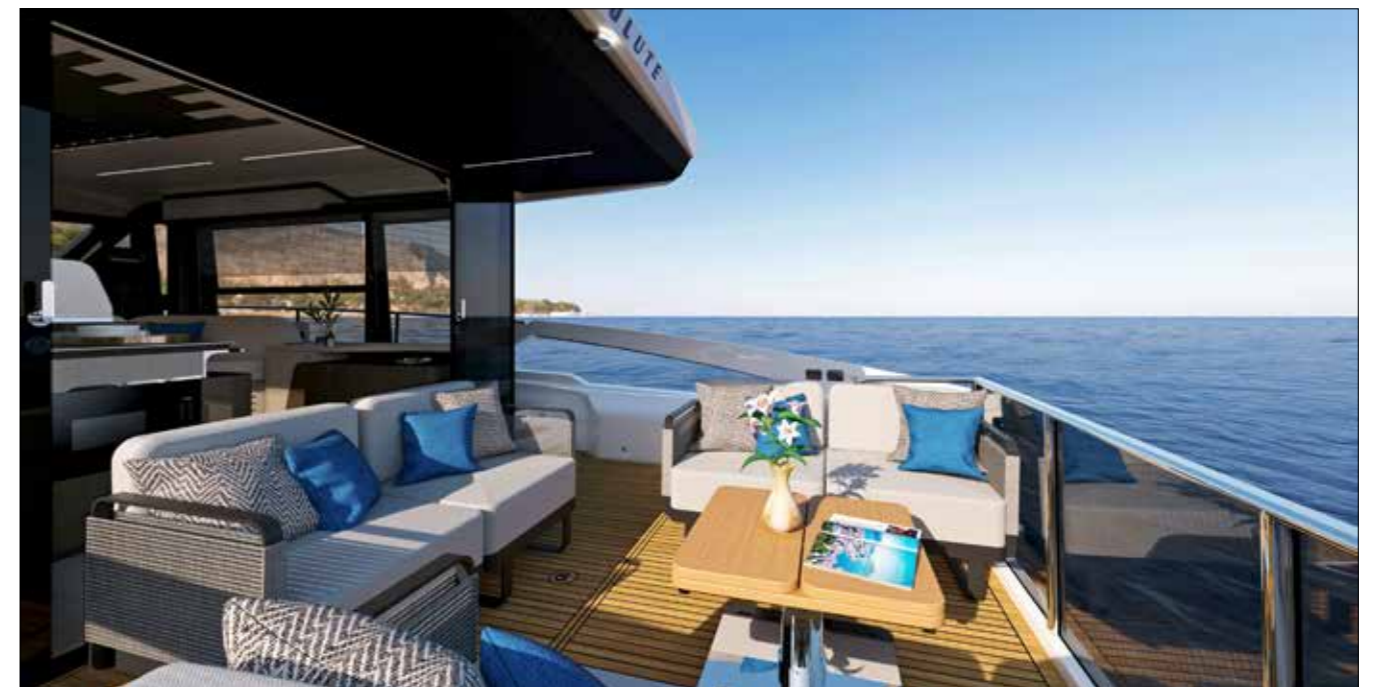
Dans le cockpit, les quatre fauteuils amovibles sur patins antidérapants se positionnent comme on le souhaite. Une vraie trouvaille!