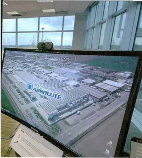
2. Absolute Dünya Basın Toplantısı'na ulusal ve uluslararası mecralardan 35 basın mensubu katıldı.

Absolute tersanesi bu yıl 83 tekne üretti. Seneye sayıyı 90'a çıkarmayı planlıyorlar. Tersane ve ofiste yaklaşık 250 kişi çalışıyor.