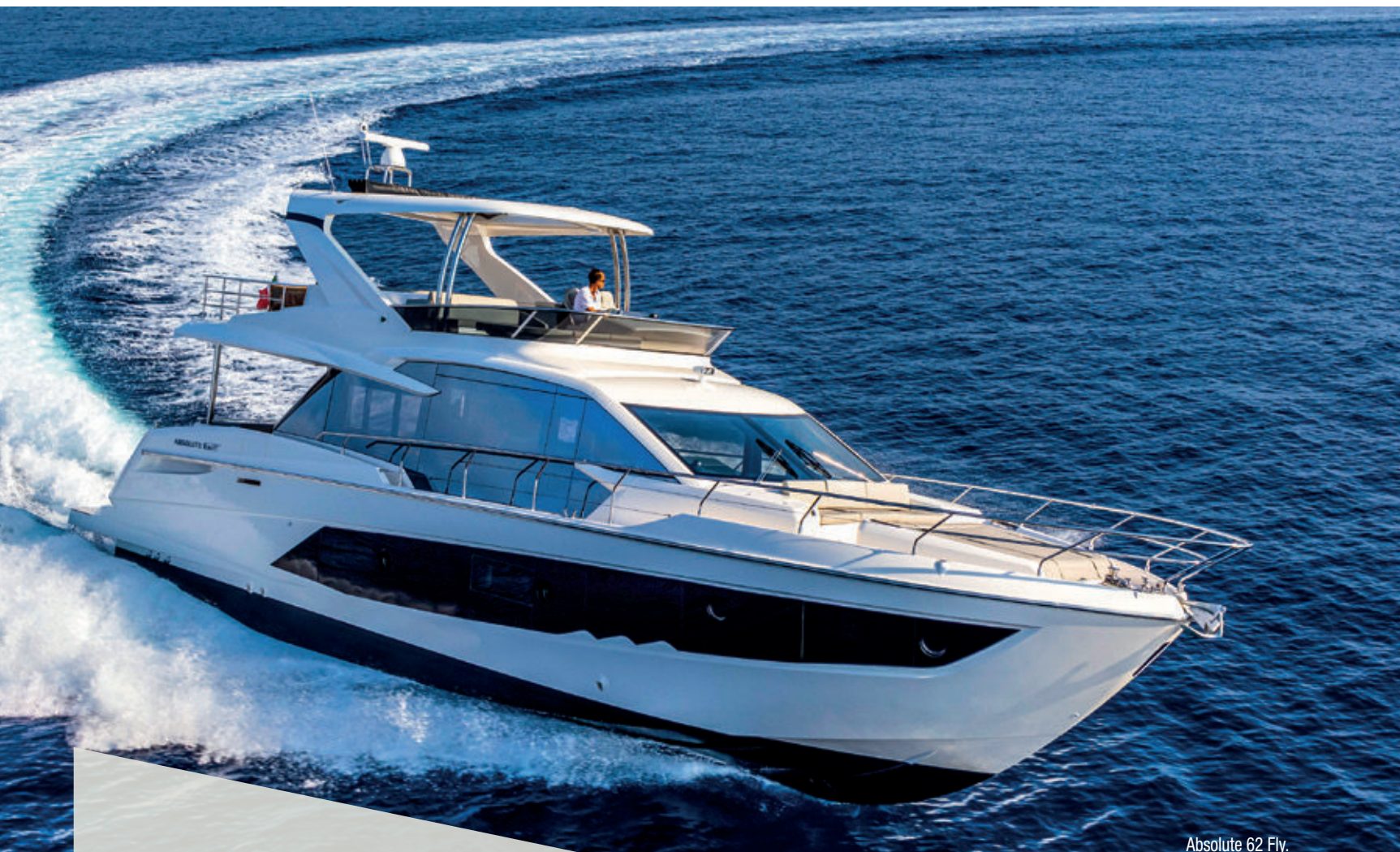
Absolute 62 Fly.

Progettualità e lungimiranza, creatività e concretezza, esperienza e attenzione al cliente. Le imbarcazioni della gamma Navetta sono diventate un must. Entusiasmo, lavoro di squadra e passione sono le parole chiave di un'azienda in continua crescita ed espansione che ha fatto dell'innovazione e degli investimenti sul territorio i suoi caratteri distintivi. La presenza di molti giovani entusiasti nel team di Absolute contribuisce fortemente alla dinamicità e all'efficienza dell'azienda.