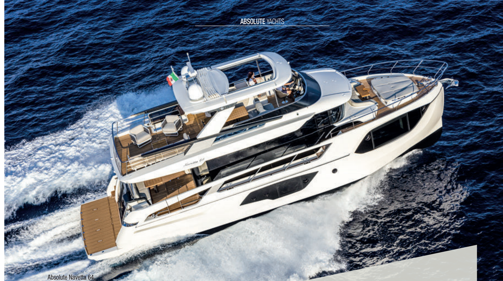
Absolute Navetta 64.