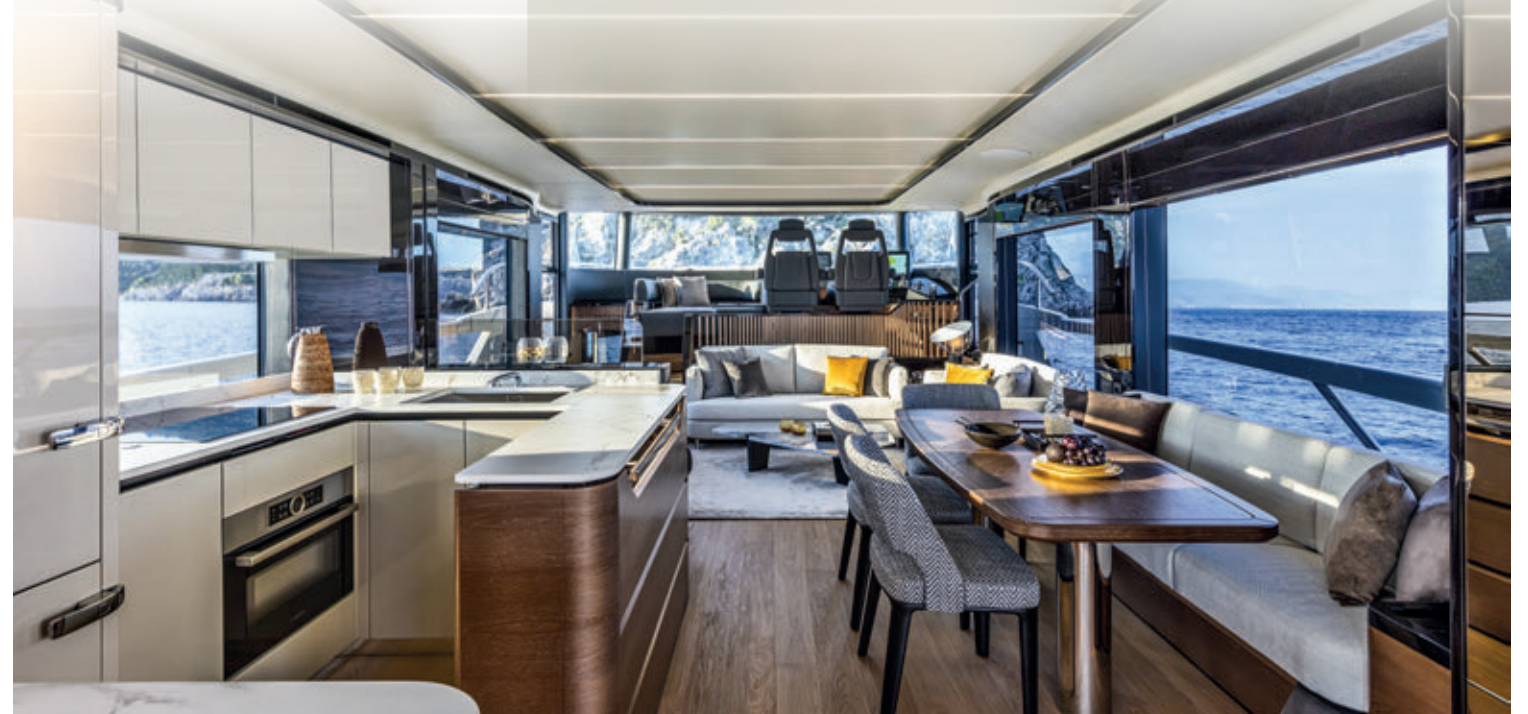
Absolute Navetta 64.

Con una produzione annua di 90/100 unità tra i 47 e i 73 piedi, Absolute è una delle realtà produttive più floride del settore nautico italiano. Un fatturato di 73,9 milioni, 250 collaboratori, più di 48mila metri quadri di cantiere. Negli ultimi tempi è cresciuta la dimensione media dei modelli, che oggi si attesta dai 58 piedi in su. La gamma si articola in tre serie Fly, Navetta e Coupé, che verrà presentata quest'anno a Cannes. Absolute vende in quasi 30 nazioni in tutto il mondo. Circa il 30% della produzione è destinata agli Stati Uniti. Ma Absolute è forte anche su altri mercati, tra cui quello asiatico, in continua espansione.