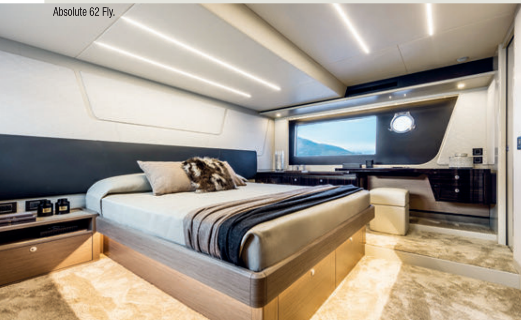
Absolute 62 Fly.

Design and forward-thinking, creativity and tangibility, experience and customer focus. The vessels in the Navetta range have become a real must. Enthusiasm, teamwork, passion and innovation are the keywords of a company that is constantly growing and expanding and that stands out for its innovation and local investments. The inclusion of lots of young and enthusiastic team members at Absolute contributes significantly to the company's dynamism and efficiency.