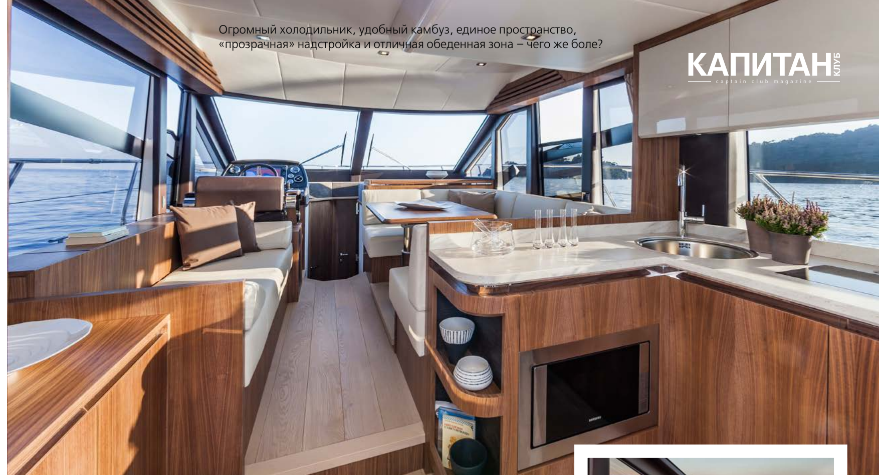
Огромный холодильник, удобный камбуз, единое пространство, «прозрачная» надстройка и отличная обеденная зона — чего же боле?

Верфь Absolute во всех своих пресс-релизах и буклетах называет эту модель маленькой мегаяхтой. Это заявление, кажущееся поначалу скорее забавным, обретает под собой почву после посещения роскошной во всех смыслах яхты. Кстати, Absolute 45 Fly уже успела покрасоваться на обложках ведущих