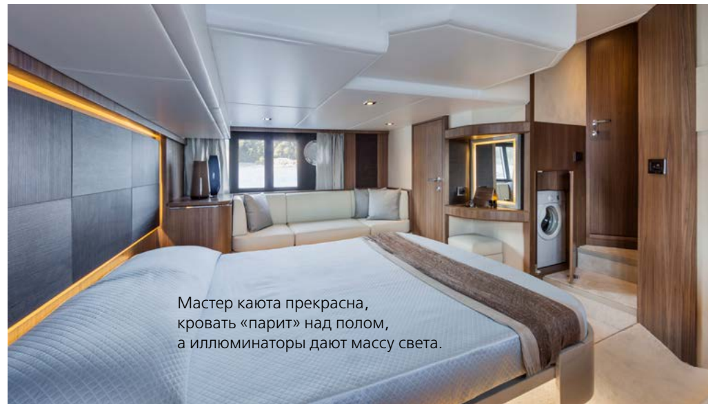
Мастер каюта прекрасна, кровать «парит» над полом, а иллюминаторы дают массу света.