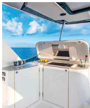
Kuchyně na horní palubě

Majitelská kajuta se nachází uprostřed lodí a je pochopitelně největší a nej pohodlnější se samostatnou koupelnou a toaletou, dámy ocení toaletní stolek. Zajímavý je přístup přes netradičně zasouvací dveře, které tak v poměrně úzké chodbě neprekážají. Stejně je řešen i vstup do majitelské koupelny. V chodbě se ještě našlo místo na dobře zamaskovanou pračku. Pod podlahou se skrývá úložný prostor a technické vybavení. Na jejich ovládání se dá ale velmi rychle zvyknout. Ve dvou větších kajutách