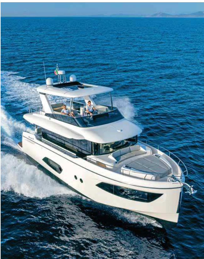
Z tohoto pohledu je dobře patrná velikost přední paluby i její uspořádání. V Prostrou lad lavičce je úložný prostor například na fendry.

trat otevíracími okny. Naproti této kajutě je společné sociální zázemí, které slouží i jako denní WC.