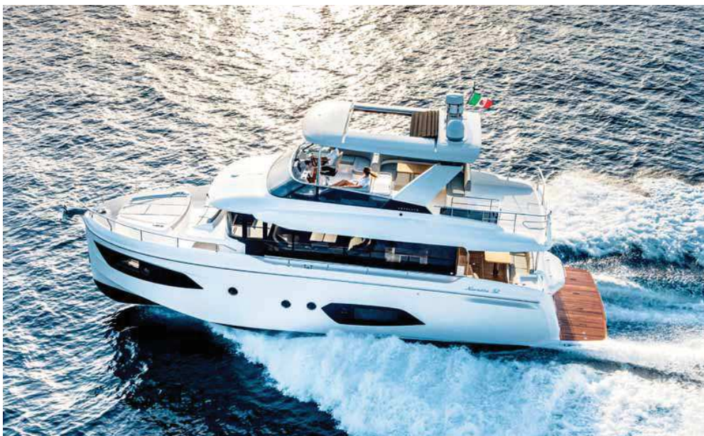
Přesto, že Navetta 52 dokáže plout rychlostí až 25 uzlů, většina majitelů bude pravděpodobně plout ve výtačném režimu.

po loď extrémní rozměry. Je zde opět velkorysý sezení u stolu i odpočinková zóna pro umístění skládacích opalovacích lehátek nebo nafukovacích hraček. Stanoviště kapitána je netradičně, ale velmi prakticky na středu lodě a je vybaveno kromě všech potřebných přístrojů i luxusním polohovatelným křeslem s opěrkami pro ruce.