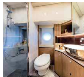
Oddělená sprcha je u této kategorie samozřejmostí.