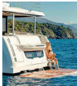
Koupací plošinu je možné hydraulicky spustit pod vodu.