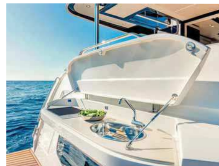
Kuchyně na koupací plošině