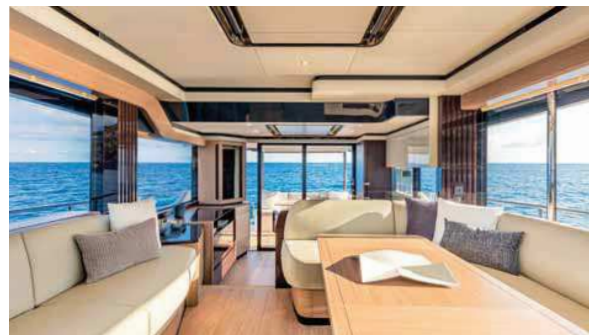
Salon je velkoryse prosklený

po celém obvodu a jejich linii přerušují jen nosné prvky a schody vedoucí na flybridge, pod kterými je vedle kuchyňské linky vysoká lednice. Salon je rozdělen dvěma schody na dvě části. V přední jsou vpravo opět dvě pohodlná křesla pro kapitána a spolujezdce. V dolní části je po levé straně umístěna kuchyň v plně veli-