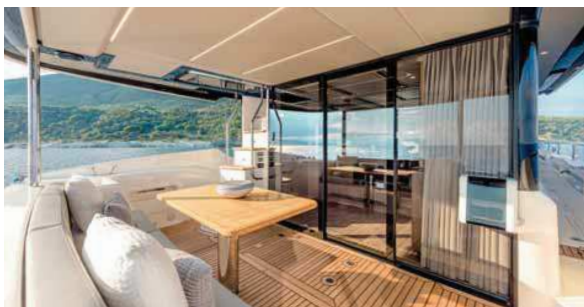
Zadní paluba je zcela chráněna střešou horní nástavby.

Před vyplutím se nyní pojdme zanořit ještě hloub do podpalubí. Tam se vstupuje ze skipperské kajuty a najdeme tam veškeré technické zázemí pro nezávislé fungování Navetty 52 a především dvojici motorů Volvo Penta D6-IPS 650, což jsou 5,5litrové moderní diesellové agregáty, každý o výkonu 480 koní. Ve spojení s pohonem IPS s nimi dokáže jachta vyvinout maximální rychlost 26 uzlů. Svoji efektivitu pohon IPS dávno potvrdil a je jisté, že tuto rychlost bude většina majitelů využívat jen na krátkou dobu v nezbytných případech. Většinu času bude loď plout příjemnou rychlostí okolo devíti uzlů. Při této rychlosti je spotřeba paliva na velmi přijatelné úrovni stejně jako pohoda na palubě,