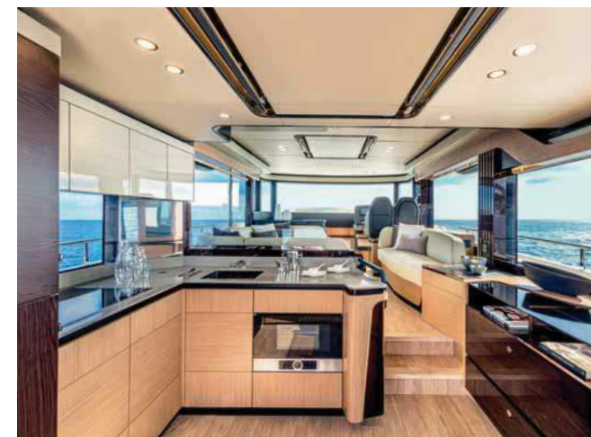
Kuchyně v salonu