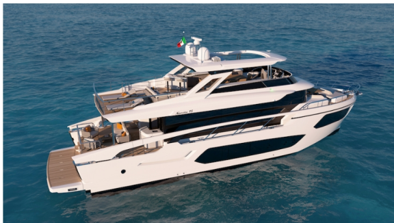
Absolute Navetta 75

Nowy „okręt flagowy” zawiera więcej ikonicznych elementów stoczni, w tym duże okna, wysokie sufity i przestrzenie zaprojektowane na jednym poziomie, zarówno na głównym, jak i na dolnym pokładzie. Kolejną cechą charakterystyczną dla Navetta 75, są szerokie, osłonięte zadaszaniem półpokłady z łatwym dostępem z kambuza i sterówki.